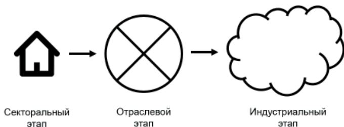
Рис. 1. Преобразование компании в экосистему

Построение подобной структуры происходит в несколько этапов. На первоначальном этапе существует предприятие, выпускающее продукт для определённого сектора экономики. Далее оно развивается за счёт дифференциации продукта и экспансии в соседние секторы той же отрасли с постепенным занятием заметной доли на рынке (рис. 1). В результате формируется крупный игрок на отраслевом уровне и выше.