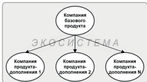
Рис. 2. Вектор управленческих воздействий в экосистеме

Такого рода воздействия стоит относить скорее к стратегическим и концептуальным, нежели к тактическим и операционным. Нередко компании, предоставляющие продукты-дополнения, являются независимыми не только в оперативных решениях, но и в формировании собственной стратегии. Обратная ситуация, когда управленческие решения направляются от партнёрской компании в сторону базовой, маловероятны.